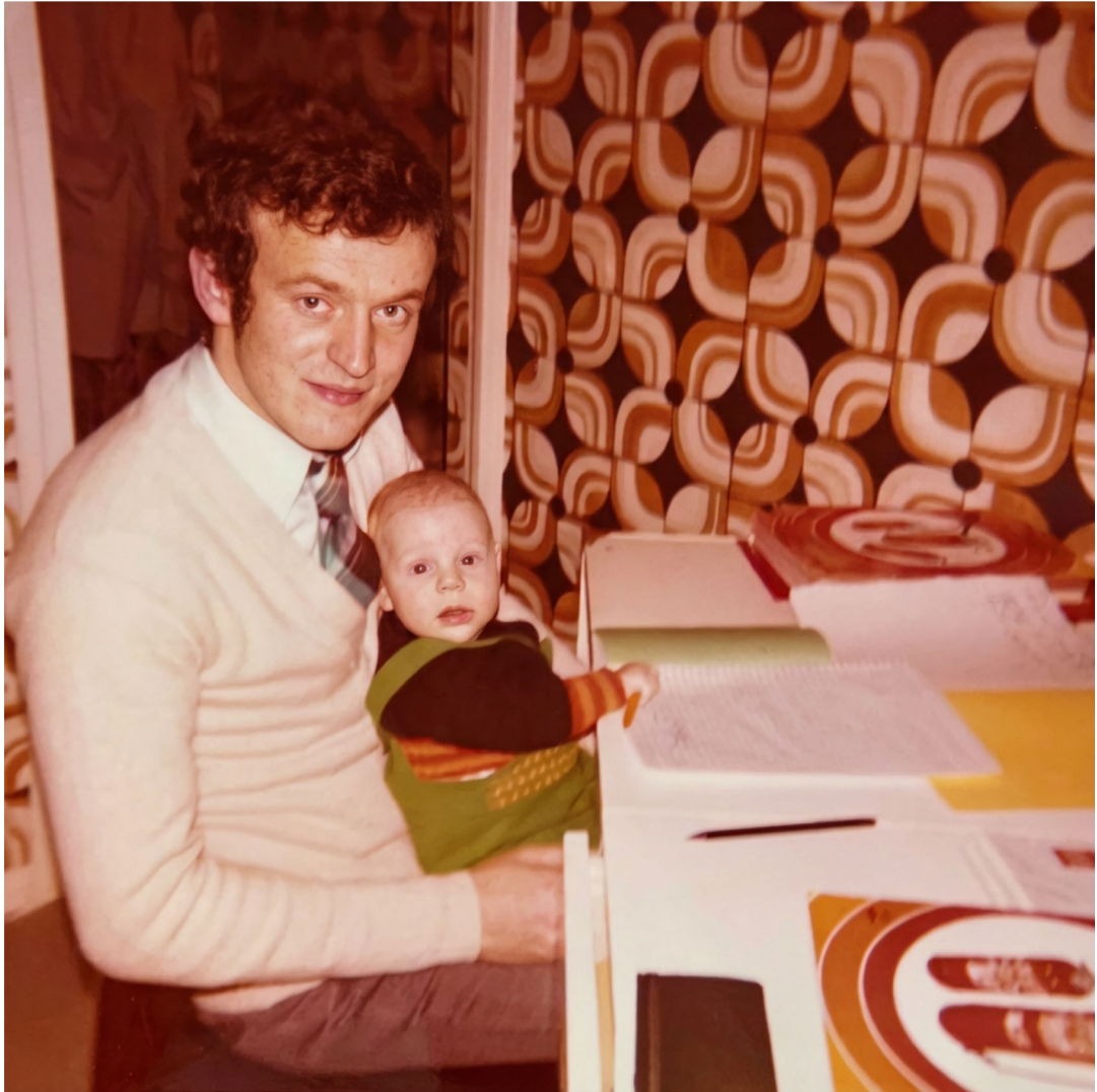
MON PÈRE ET MOI (en 1975)